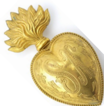
Cœur ex-voto métal, XIX-XX e siècle © Dominique Dirou

Depuis le XVII e siècle, les pèlerins remercient sainte Anne en lui offrant de nombreux présents. Appelés ex-voto, ces objets remplis d'émotions et souvent insolites sont à l'origine des collections du site.