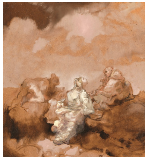
Sainte Angèle et ses fils huile sur panneau, 43 x 40 cm